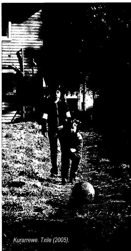
Kurarrewe. Txile (2005).

Jakin badakigu ipuin bat, istorio bat entzutean emozioak bizi izaten ditugula. Hitz eta berbek mugiarazi egiten gaituzte. Eta irakurtzerakoan ere gertatzen da hori, nahiz eta prozesua konplexuagoa izan. Badira liburu teoriko batzuk intelektuala eta emozionala nahastean sortzen den eremu bitxi horretan barneratzen gaituztenak. Emozioaz gogoeta egitea, gizakiaren ulerkuntza bihurria eraikitzea zeregin zaila da, ezin zaiolarik gizaki horri bere emozio -eta erlazio- funts hori kendu.