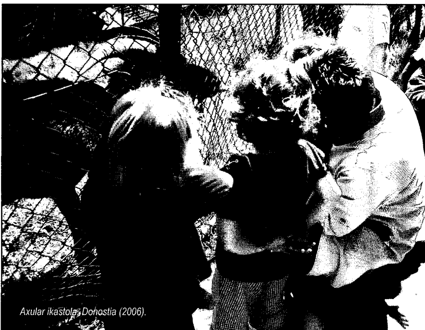
Axular Ikañstola, Donostia (2006).

Hezkuntzako nahiz prebentzioko praktika psikomotorrean, taldeko nahiz banako laguntzan, fase ho- ni honela deitzen zaio: segurtatze sakona hizkuntzaren bidez (2004, 186, 225, 261). Banako lagun- tzari dagokionez, testu hau azpi- marratuko nuke: “Psikomotrizis-