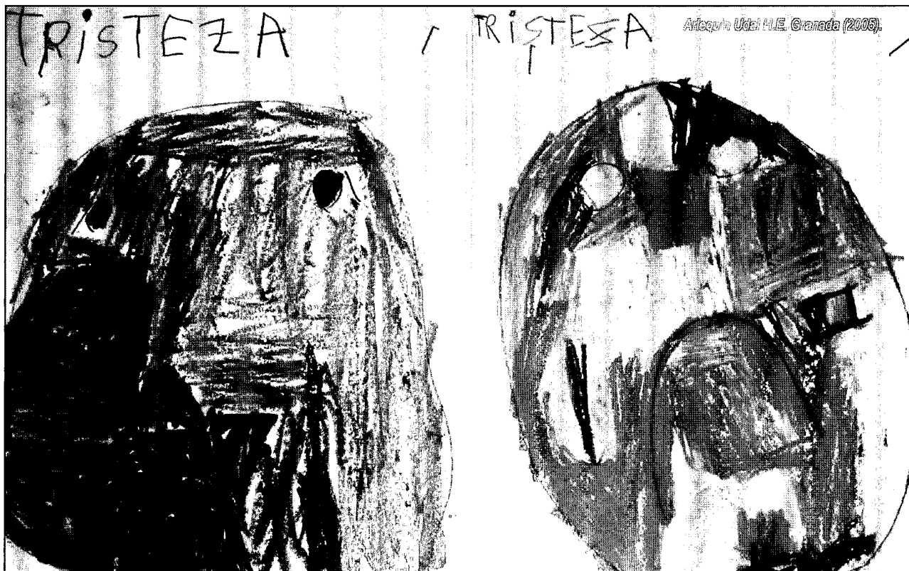
Artxan Udal H.E. Granada (2005).

Laguntzako hizkuntza honek hitz sustraituak bilatzen ditu, eta pertsona-haur nahiz heldu-bere historia afektiboarekin, guggan, gure gorputzean erregistraturiko erlazio-historiarekin lotuta dagoenean agertzen da. Segurtatze sakona hizkuntzaren bidez ahalbidetzen duena gorputzaren bidezko segurtatze sakona da.