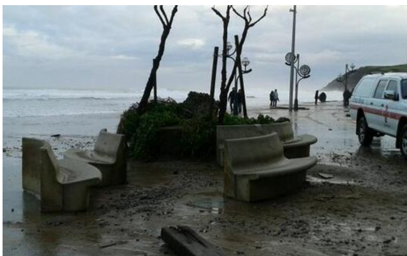
Paseo de Zarautz, febrero de 2014 (Lorena Lopez de Lacalle).

En la Tabla 1 se ofrece una visión general de un amplio abanico de opciones de adaptación y de cómo estas se complementan con medidas de desarrollo humano y planificación, el cambio transformacional de las sociedades y los esfuerzos de mitigación.