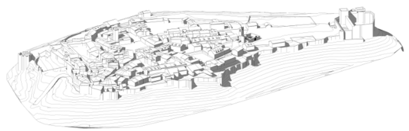
VOLUMETRIA DE PEDRAZA