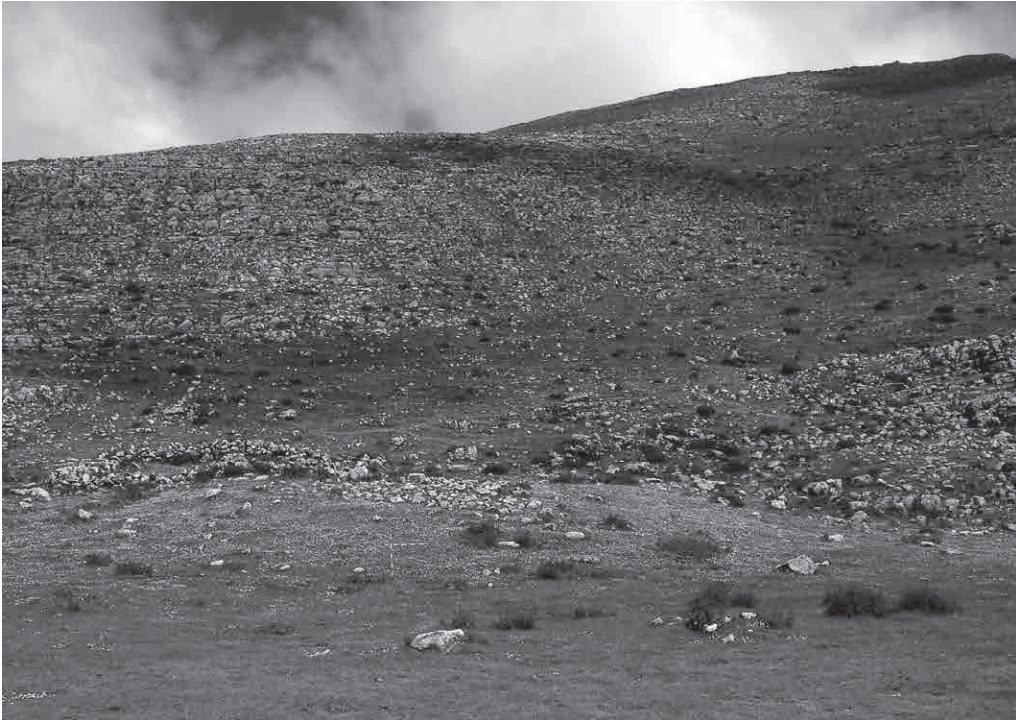
FOTO 5. Túmulo de Aintzizegi, ubicado en el contacto de la base de la ladera y la llanura existente en el fondo del vallecito. Directamente sobre él se ha construido una estructura con muretes de piedra seca. A un lado se aprecia un redil