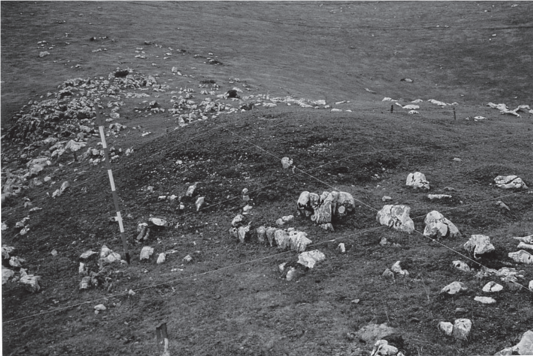
FOTO 2. Túmulo de Arrubi, ubicado en una cresta existente entre dos depresiones