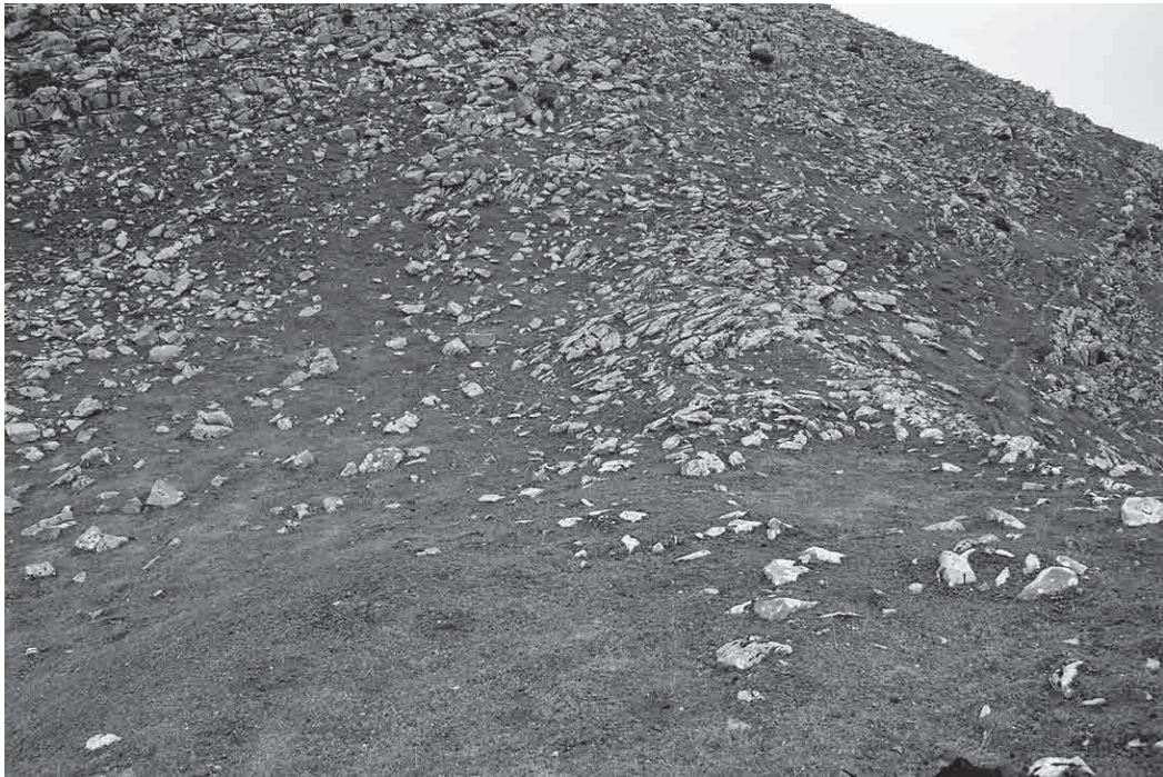
FOTO 9. Túmulo de Gañeta a la izquierda de la fotografía y sobre él, pero a la derecha, un recinto rectangular —posible redil—