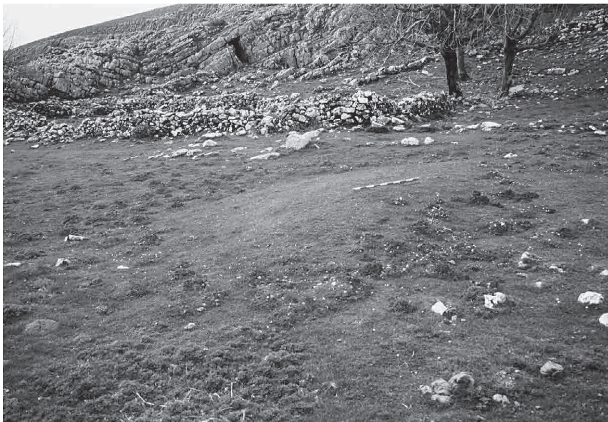
FOTO 7. Túmulo de Bilingaratz en el que se observan las tierras removidas por los topos en toda su periferia

en esos indicios podemos presuponer que nos hallamos ante restos correspondientes a la fase inicial de formación de una nueva estructura tumular.