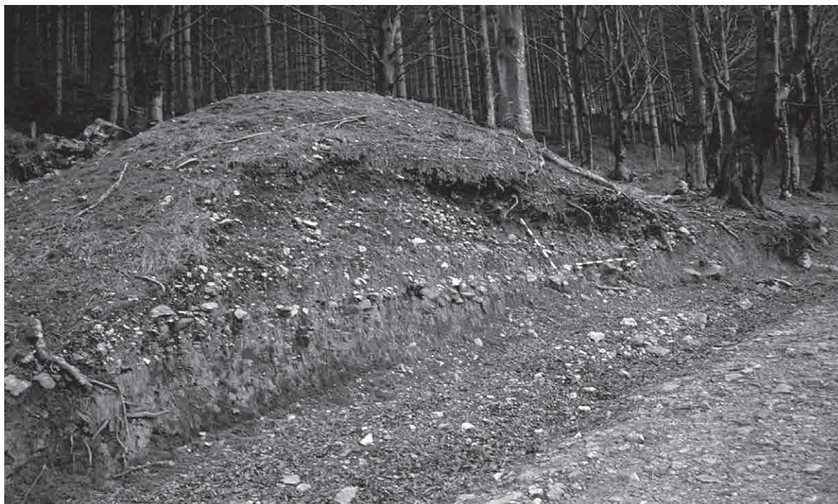
Foto 4. Túmulo de Labaien cortado por una pista

y Aintzizegi 39 con 19 \times 13 metros y una altura de 1,70 (Fot. 5). A pesar de ello hay que señalar que las intervenciones realizadas han permitido determinar que la altura real de estas estructuras era sensiblemente inferior a la que aparentemente se apreciaba a simple vista. En concreto, en ninguna de las tres estructuras estudiadas hasta ahora se ha llegado a superar el medio metro de potencia (Fot. 6).