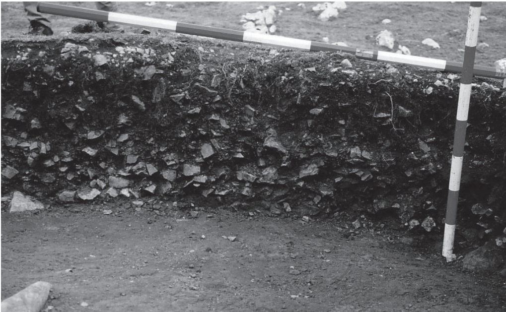
FOTO 6. Detalle del corte del túmulo de Arrubi en el que se aprecia la escasa potencia de la estructura y el color oscuro del sedimento, y el abundante cascajo presente en toda su potencia