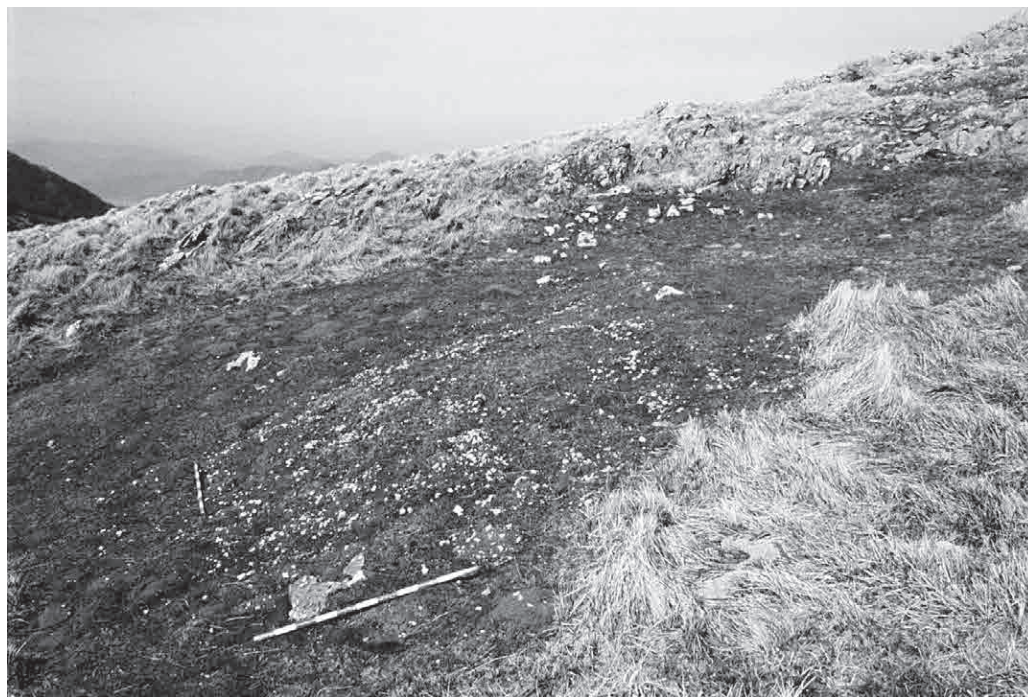
FOTO 8b. Tímulo de Arangoene: construido en la ladera. Sobre él asoma la grava que constituye dicha estructura y que ha sido removida por los topos