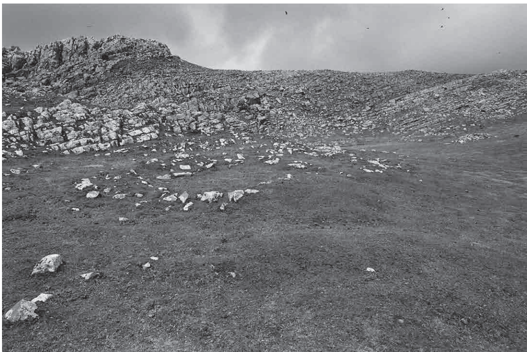
FOTO 10. Dos túmulos adosados de Uarrain y un recinto que afecta a una de las estructuras