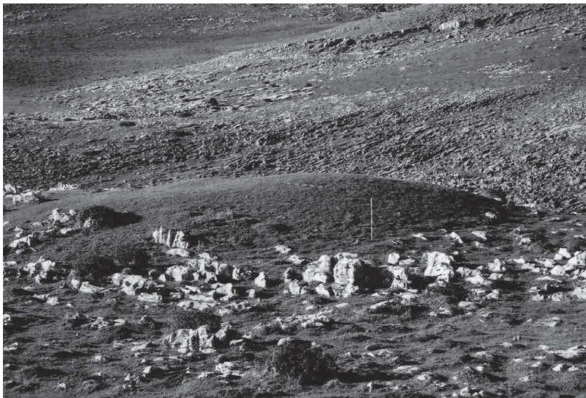
FOTO 12. Túmulo de Akaizbita, situado en un rellano

ese emplazamiento por sus antepasados, mientras que otras veces se reivindican los vestigios o ruinas de esas majadas como prueba de su antigüedad y su ocupación desde tiempo inmemorial 5 (Fot. 12).