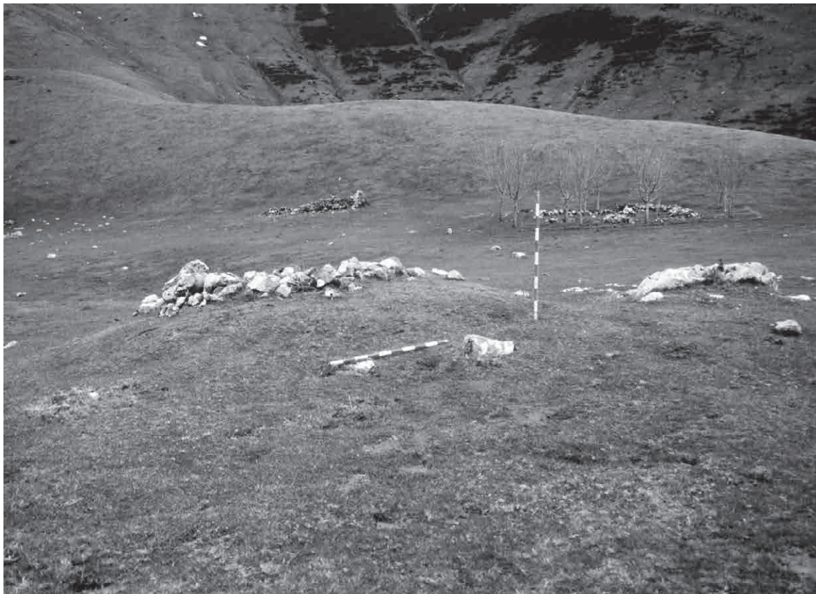
FOTO 13. Túmulo de Etitze con una estructura superpuesta sobre ella