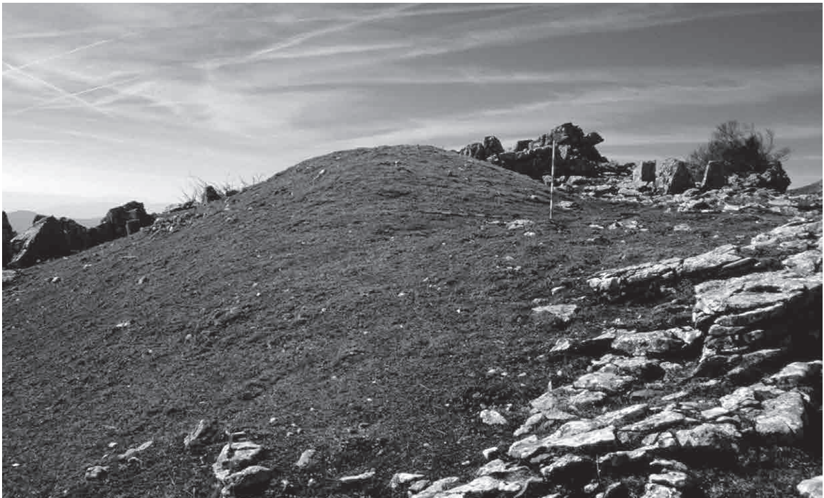
FOTO 11. Túmulos construidos en zonas de gran visibilidad y con estructuras adosadas: Egurral (11), Eitzegi (11b), Elutseta (11c) y Pagabe Goikoa (11d)