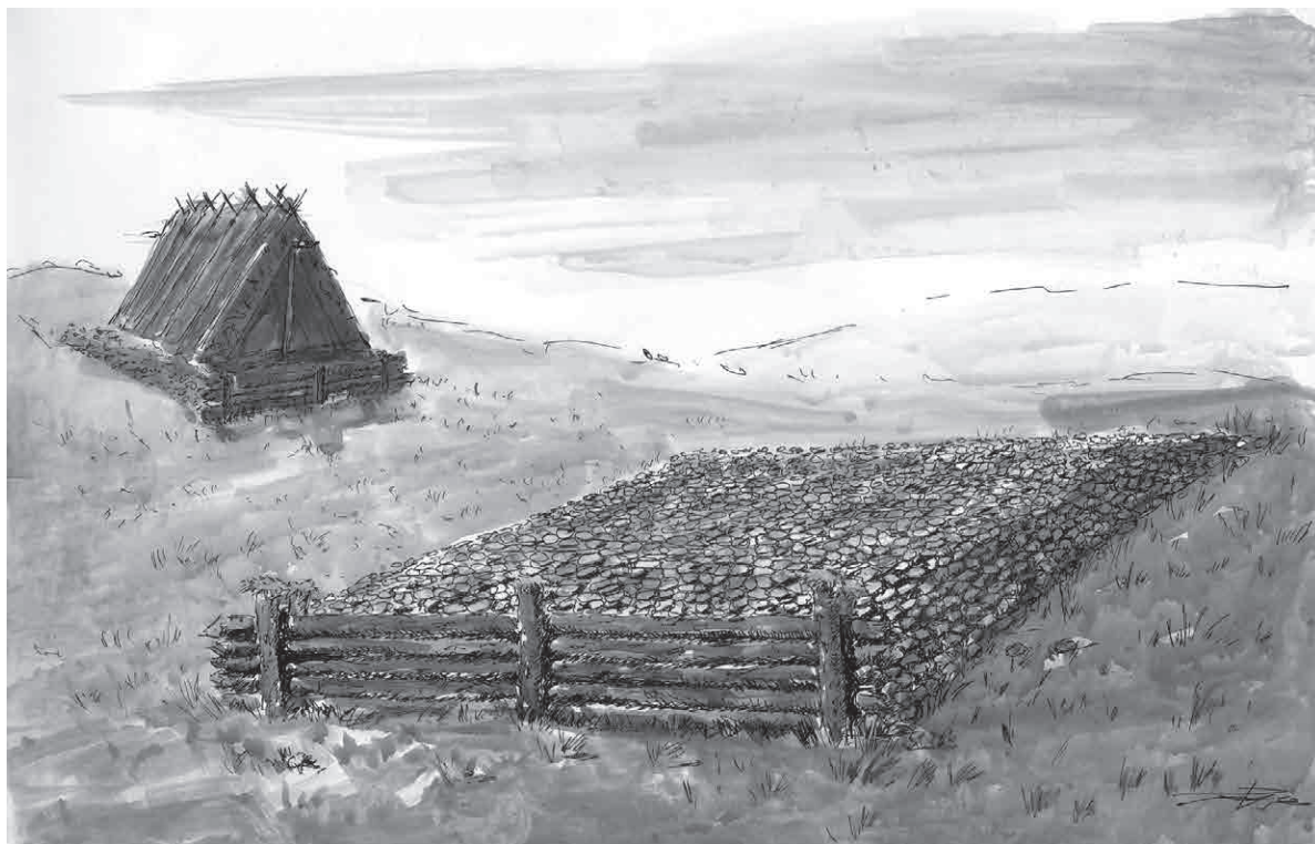
FIGURA 1. En primer plano una hipotética plataforma que se construiría en una zona en pendiente. Su altura inicial sería menor, pero como resultado de la frecuentación del lugar y las sucesivas remodelaciones o reconstrucciones iría incrementando su altura con el paso del tiempo (Ilustración de Jokín Tellería)

Si atendemos a la ubicación específica de algunas de estas estructuras (en cambio de rasante, en ladera, etc.) se nos hace difícil reconstruir las características formales de las mismas, y sobre todo el modo de construir y retener la estructura tumular, dada la dificultad que supondría establecer una superficie más o menos horizontal en esos emplazamientos. Suponemos, puesto que carecemos de testimonios arqueológicos de ello, que la única manera de habilitar un espacio habitable sería mediante la realización de una especie de «caja» o barrera ejecutada con troncos o estacas que irían clavados verticalmente a modo de contrafuerte del terreno (Fig. 1 y 2). Una vez abandonada definitivamente la cabaña, el proceso de degradación natural de esa estructura lúnea tendría como consecuencia el derrumbe paulatino de la porción de túmulo que se apoyaba sobre esa barrera, des-parramándose ladera abajo 4 .