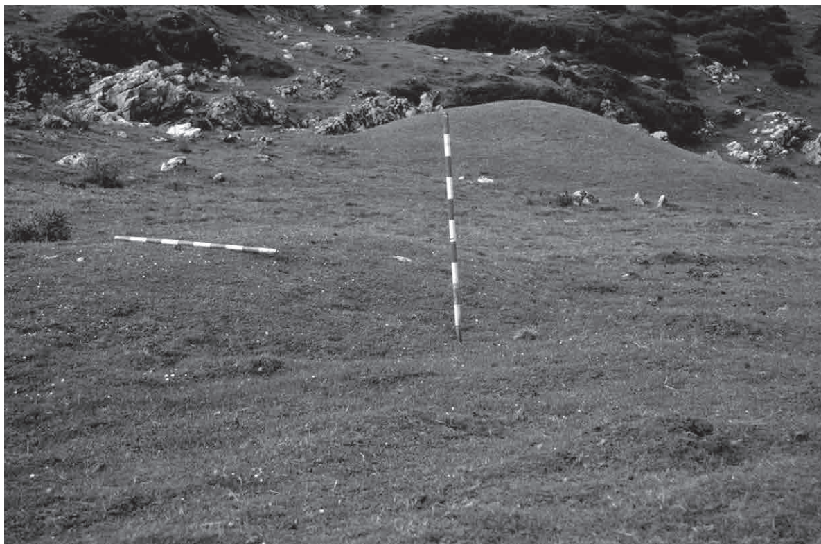
FOTO 1. Dos de los túmulos de Pontoa, en los cuales se observa la diferencia de tamaño de ambos elementos

de la que nosotros proponemos: «En la pendiente hacia Ubedi excavamos el galgal con césped, pero no encontramos más que ceniza en el fondo, probablemente originada por la cremación de cadáveres de animales en tiempos de epizootia» (Aranzadi, T. et alii: 1919, 31, nota 1). En otro párrafo nos relatan otra intervención realizada en la zona de Oidui y en la que se señala textualmente que «hicieron la excavación de uno de estos túmulos, y en concreto uno situado en la zona de Supitaitz sin localizar resto de interés alguno y descartado claramente el carácter dolménico de la estructura en cuestión» (Idem, 25). Los datos disponibles tanto sobre ambas excavaciones como sobre las características específicas de esas estructuras tumulares (en caso de serlo) son totalmente insuficientes para interpretar los resultados obtenidos de una forma u otra, si bien a priori caben amplias posibilidades que nos encontrásemos ante una de estos fondos de cabaña tumulares como los que estamos tratando en el primero de los casos, y ante una estructura tumular arcillosa (tipo A1 en la clasificación que posteriormente realizamos) en el segundo de los casos.