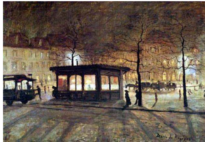
Ilustración 3. Darío de Regoyos, "Efecto de luz" (1881)

Si Basterra no tomó sino las claridades y no era hombre para descender a las tinieblas - retomando las palabras de Juan de la Encina -, Darío de Regoyos sí siguió a Verhaeren en sus “periplos por lo horrendo y tenebroso”. Lo hizo sobre todo durante el viaje que realizaron juntos por la península ibérica en 1888 y que dio lugar a la España negra , creando una imagen decrépita y decadente de España y trasladando al espacio peninsular el topos de la ciudad muerta y la geografía de una auto-conciencia atormentada 52 , pero también lo hizo, aunque de modo muy diferente, en los nocturnos de ciudades modernas como Bilbao, San Sebastián o Bruselas. Estos nocturnos no tienen nada que ver con el imaginario “neurasténico” de la España negra o del “Album Vasco”. Regoyos quiso en ellos reflejar los efectos de la luz nocturna en el paisaje urbano, los efectos de la luz de gas y de la luz eléctrica, símbolo del progreso moderno. Esa luz que iluminaba “miseria y opulencia: la luz de las farolas mostraba pobreza, tristeza, muerte, angustia, alcohólicos, prostitutas..., pero también una serie de maravillas, coches, puentes, vías férreas, edificios, cables eléctricos...” 53 . Compartiéndola con Émile Verhaeren, Regoyos manifestó su predilección por la luz nocturna de las ciudades modernas desde sus primeras obras realizadas en los años 1880 en Bruselas, antes de trasladarla al paisaje urbano de Bilbao.