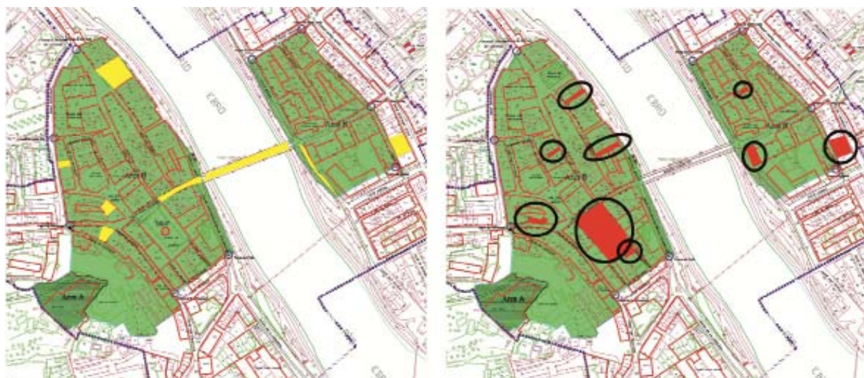
Figura 1. Área de protección arqueológica del PERI del Conjunto Histórico de Miranda de Ebro, con declaración en el año 2005. Izquierda: lugares dónde se han realizado obras sin controles arqueológicos establecidos por la norma municipal. Derecha: solares en los que se han ejecutado intervenciones.

Nos quedan muchas áreas en sombras o incluso en la oscuridad más absoluta si pensamos que mucho del patrimonio arqueológico que tenemos pasa totalmente desapercibido, desde el que está enterrado hasta el que está a la vista en forma de viejo palacio renacentista o de moderna instalación fabril, sin embargo nos queda la esperanza de que una sociedad más formada y, por tanto, más inteligente, sepa reclamar lo que es de su propiedad -pero en usufructo- y que debe dejar, aumentado, en herencia a su descendencia.