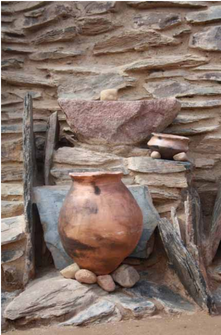
Lámina 5. Detalle del banco de molienda tras los trabajos de conservación (Proyecto Peñalosa)

Por último, en el análisis del contexto doméstico y sus objetos tenemos que hacer referencia a una actividad que jugó un papel importante en el desarrollo de la vida cotidiana de esta vivienda, la producción textil (Figura 1). Ésta se advierte en el extremo centro-oriental de la vivienda. Puntualizamos “se advierte” porque como es sabido la conservación de las estructuras de telar en la Prehistoria Reciente es prácticamente nula, sin embargo, para su documentación contamos con la presencia de evidencias indirectas (objetos) que intervienen en su producción: pesas de telar, punzones, leznas, agujas, etc. (Figura 2: 12). En asociación con el banco corrido del extremo oriental se documentó una concentración de pesas de telar (más de 18 unidades) (Figura 2: 10 y 11) tanto sobre esta estructura como en las zonas contiguas. A juzgar por su disposición y orientación, éstas estarían unas tensando los hilos de la trama del tejido en proceso de fabricación, mientras que el resto estarían depositadas unas sobre posibles estanterías y otras, recién fabricadas, secándose sobre el mismo pavimento. Este