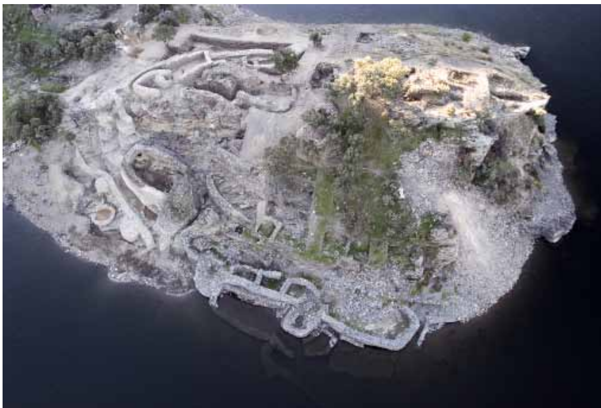
Lámina 1. Vista área del poblado argárico de Peñalosa (Proyecto Peñalosa)