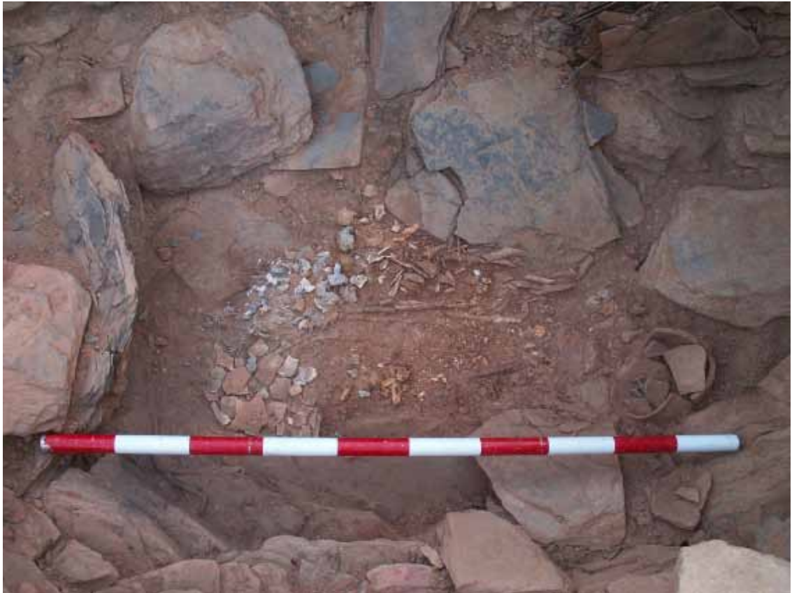
Lámina 6. Sepultura 18, enterramiento doble (Proyecto Peñalosa)

la dispersión de los objetos en la sepultura asociados directamente al cuerpo femenino, podríamos apuntar que dichos objetos pertenecerían al ajuar de la mujer.