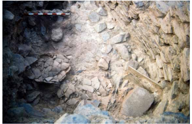
Lámina 4. Detalle de la estructura de banco de molienda y orzas localizadas in situ en la vivienda X (Proyecto Peñalosa)

La siguiente pregunta que nos debemos plantear sería ¿Dónde realizaron estas prácticas de cocinado y qué soportes utilizaron?. En todas las viviendas de Peñalosa se establece una constante relación entre el almacenamiento, procesamiento, cocinado y consumo de alimento. Concretamente, en nuestro caso, estas actividades se localizan en su extremo sur-suroeste. Para llevar a cabo determinadas prácticas de cocinado utilizaron al menos dos tipos de ollas, unas de cuello marcado y otras de paredes entrantes de mediano, ambas de paredes gruesas y fondo convexo, y gran tamaño (Lamina 2: 1 y 2) asociadas a tapaderas de pizarra. Ambos tipos de ejemplares se