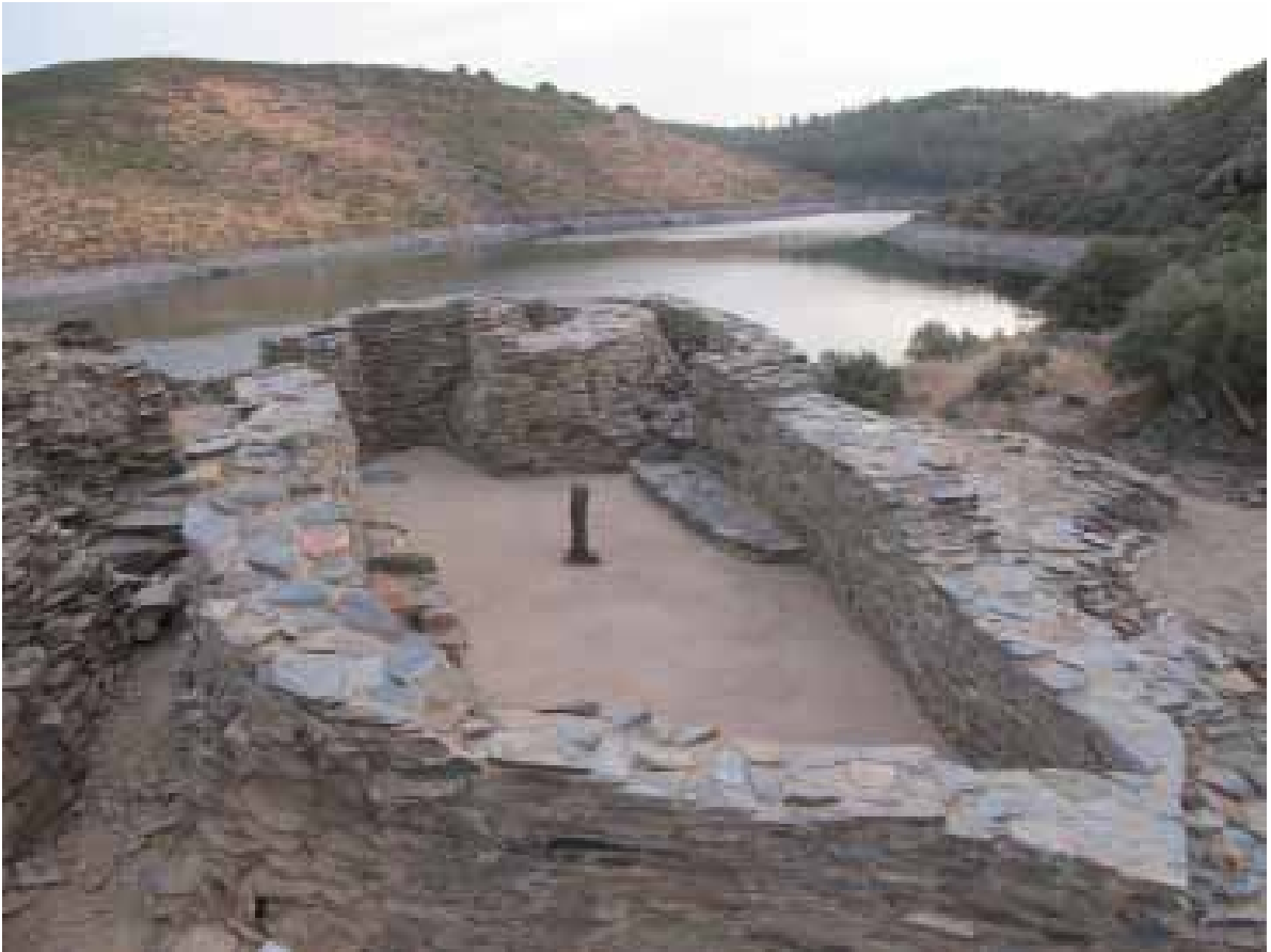
Lámina 3. Panorámica de la vivienda X del poblado de Peñalosa tras los trabajos de conservación realizados en el verano del 2010 (Proyecto Peñalosa)

grandes cantidades de grano, el cual, una vez triturado a través del proceso de fricción sería depositado y almacenado en forma de harina u otra variante en la estructura de lajas hincadas situada contigua a este banco (Lámina 4).