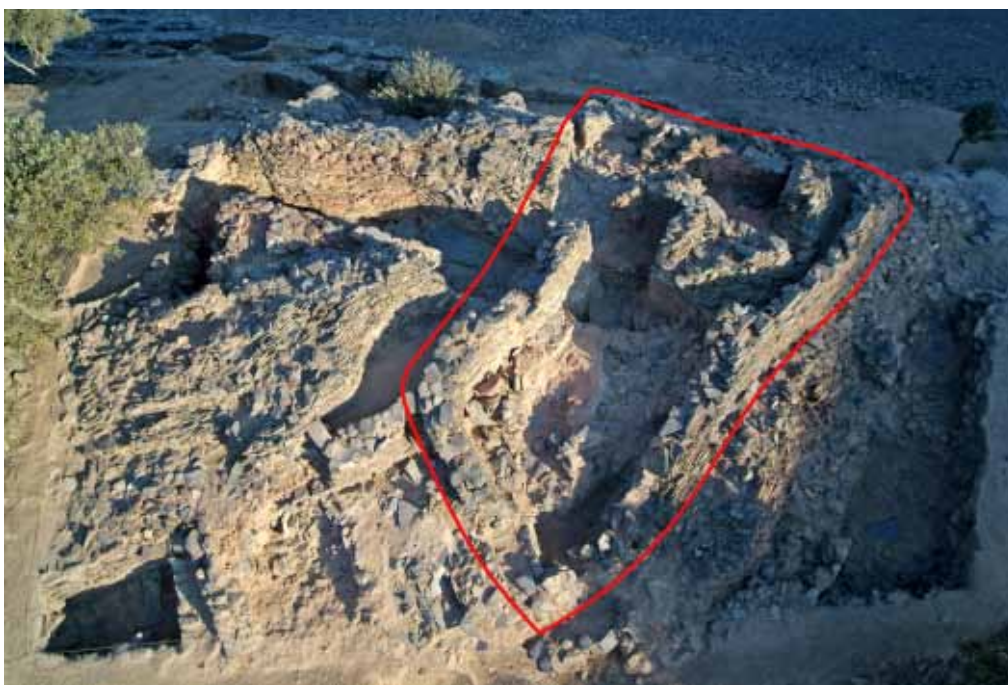
Lámina 2. Detalle de la "Acrópolis Oriental" en la que se inserta la vivienda X (Proyecto Peñalosa)