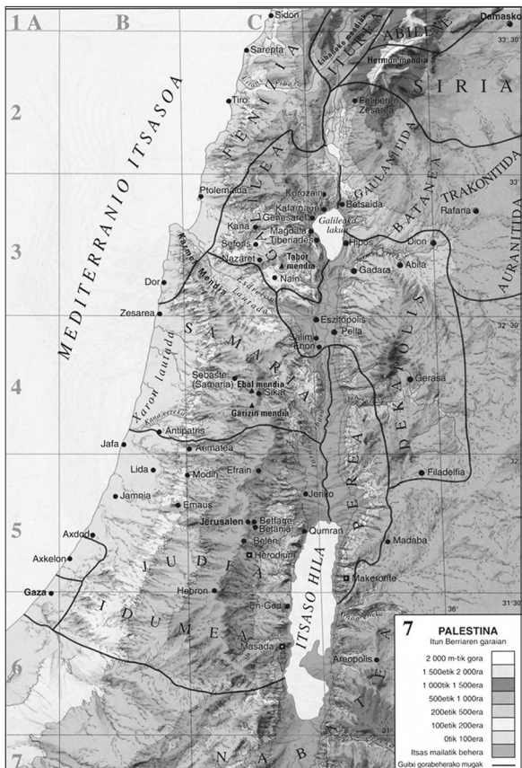
Palestina Itun Berriaren garaian (Elizen arteko Biblia, 1994)

sen garaian Palestina Judea, Samaria, Galilea eta Perea eskualdeetan zatitua aurkitzen zen eta, batzuen ustez, Idumea ere bai; IV. mendean, Konstantinorekin, Palestina kristauen lurralde bihurtu zen; gero, ordea, musulmanek hartu zuten 634-640 epealdian; gerora, 1099an, gurutzatuek Jerusalemgo erresuma latindarra sortu zuten; Egiptoko mamelukoek, 1291n, gurutzatuak ohilduta, lurralde osoa menperatu zuten; 1516an, Siria eta Egiptorekin batera, Palestina otomandar inperioaren menpe geratzen da lau mendez; baina 1916an, arabiarrek, Britainia Haundiak aginduta, otomandarren kontra matxinatu ziren.