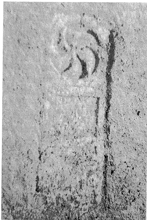
Inscripción n.º 2