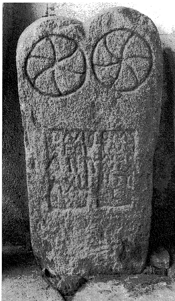
Inscripción n.º 10