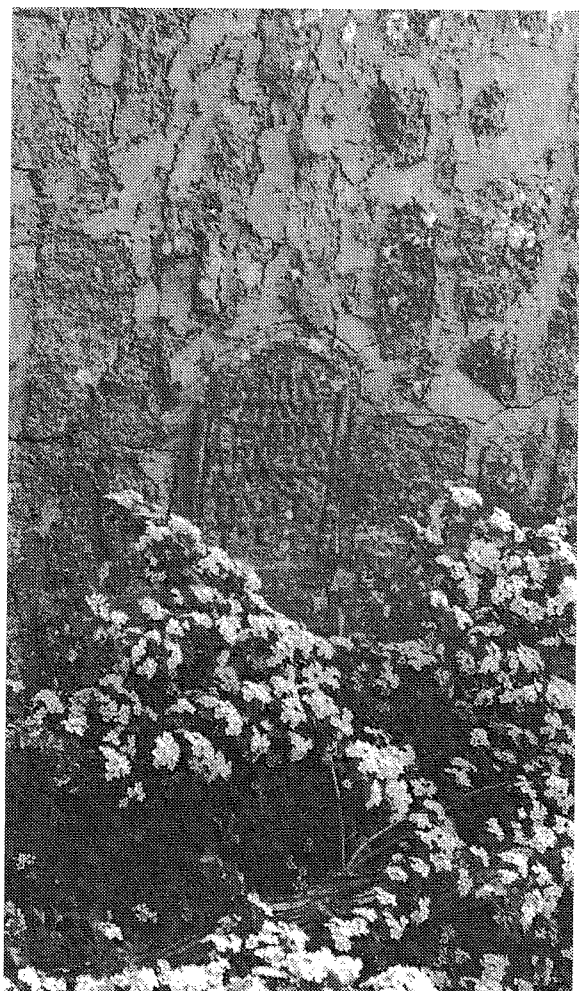
Inscripción n.º 9