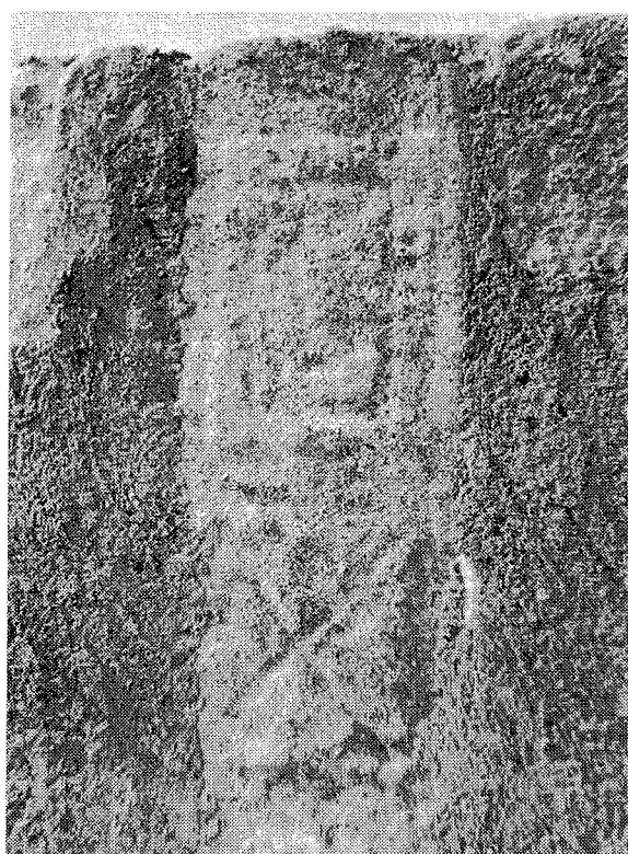
Inscripción n.º 4