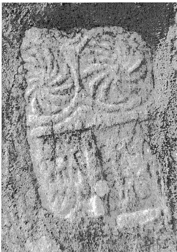
Inscripción n.º 5