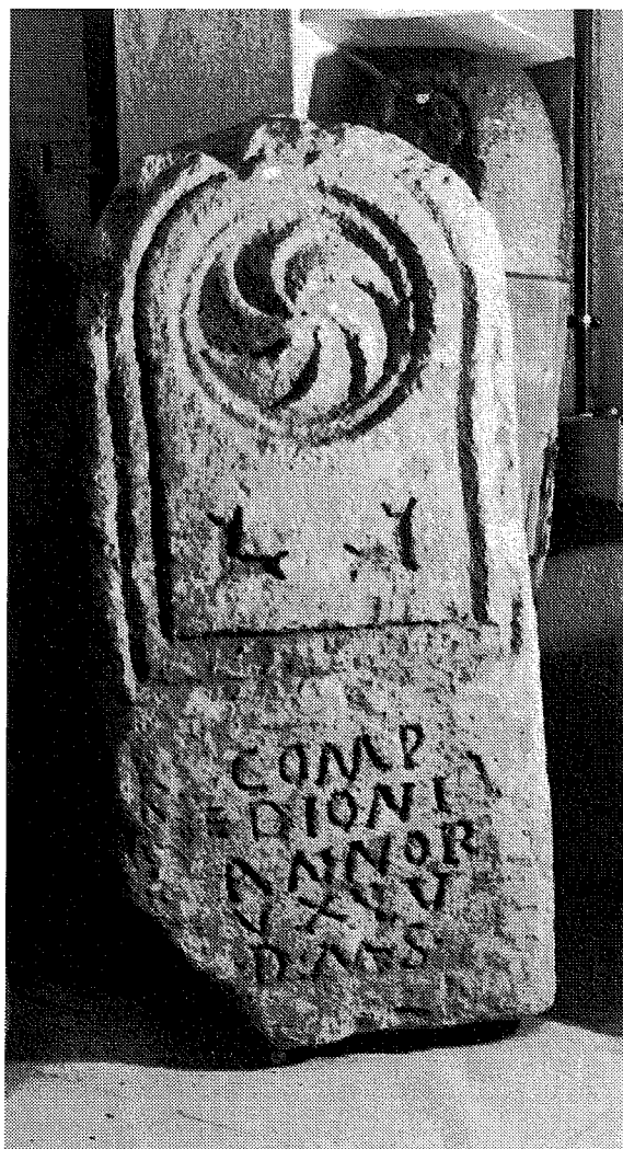
Inscripción n.º 12