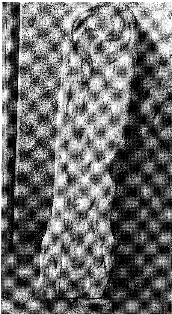
Inscripción n.º 11