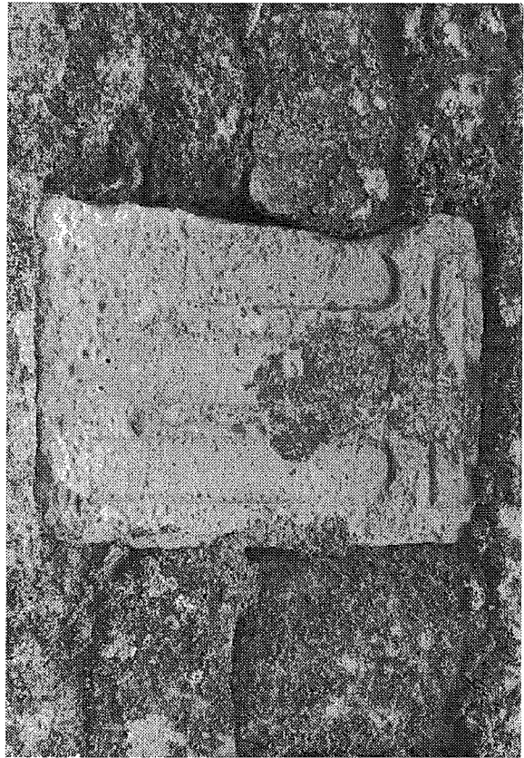
Inscripción n.º 8