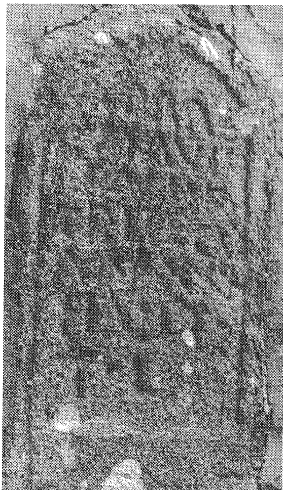
Inscripción n.º 9 (detalle)