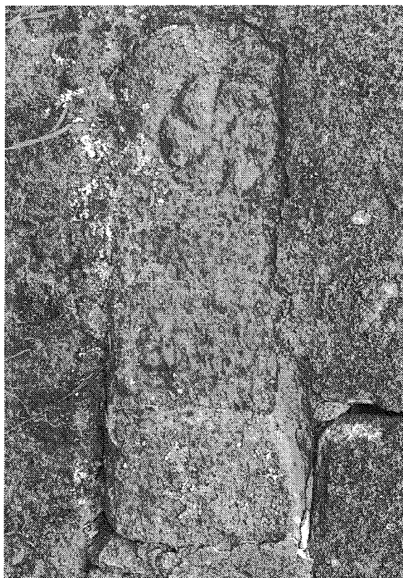
Inscripción n.º 6