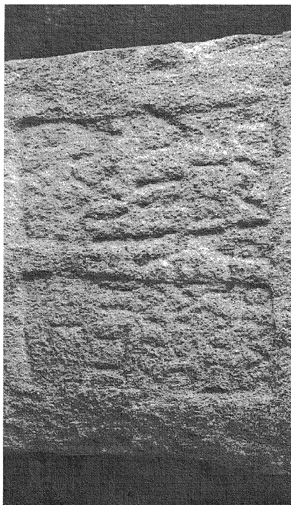
Inscripción n.º 10 (detalle)