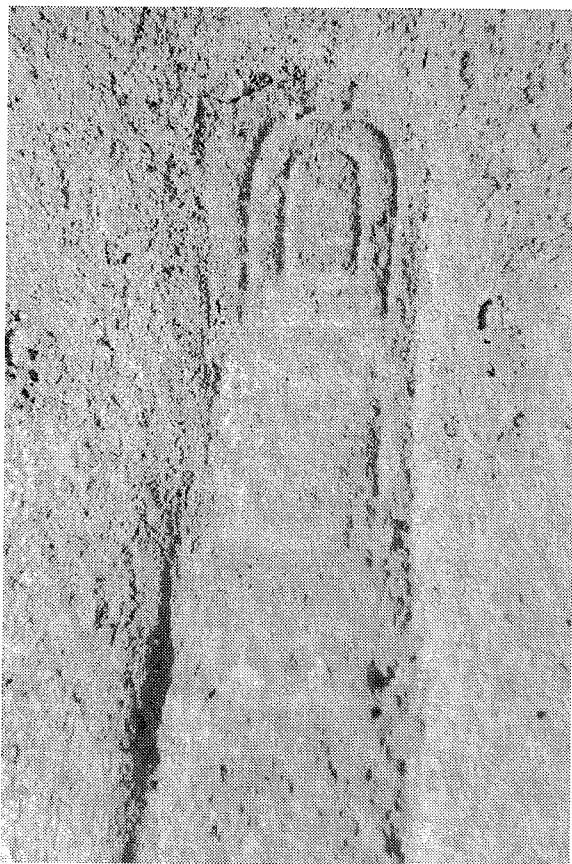
Inscripción n.º 1