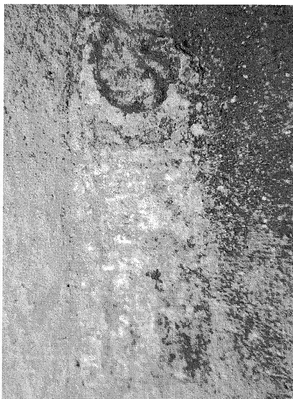
Inscripción n.º 3