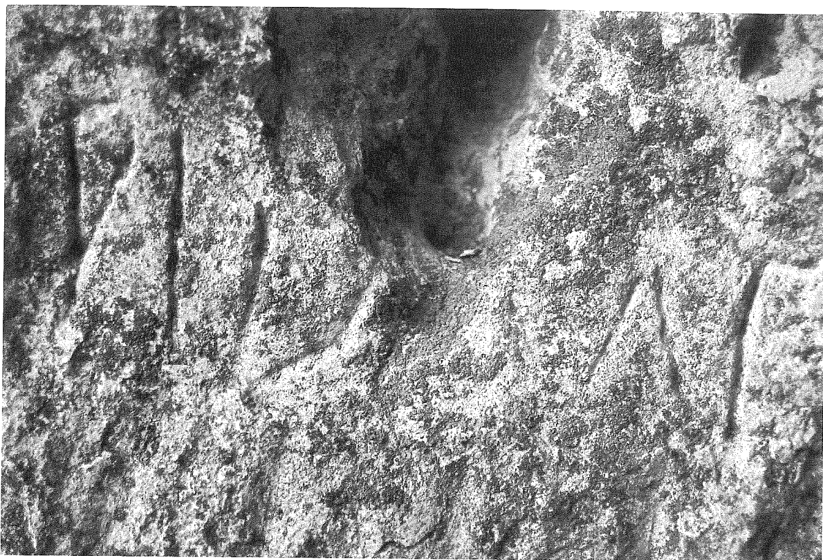
LÁMINA 4. Inscripción rupestre de la Cueva Labrada (detalle)

Ianua con el sentido de puertas, de entrada, es habitual en latín (v. ThLL ). Y más aún el de «vano que permite la entrada a un recinto», es decir vano por el que se accede a un espacio 4 , a una habitación, que parece el significado que podría tener en este contexto, frente a términos más materiales como fores , ostia , porta .