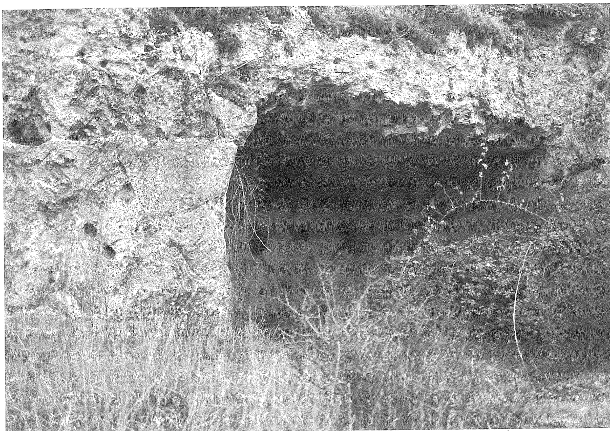
LÁMINA 1. Cueva Labrada (vista general)

La cueva, que se conoce popularmente con el nombre de Cueva Labrada, se encuentra cerca de la Fuente del Caldero y puede observarse que se ha tallado la roca (de donde su nombre probablemente) hasta conseguirse un espacio interior casi rectangular de seis metros de anchura en la embocadura, orientada hacia el norte, y una profundidad que oscila entre 3,85 y 5,70 m (v. lám. 1). La pared que sirve de fondo no es uniforme y presenta unos poyos que han podido servir de asientos aprovechando una inmejorable vista sobre el valle. Nos queda constancia de que ha sido hasta hace no mucho tiempo un lugar frecuentado en sus paseos por las gentes de Sepúlveda, por lo que se hace aún más extraño que la inscripción haya permanecido inédita hasta hoy 1 .