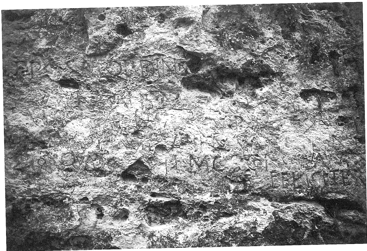
LÁMINA 3. Puente Talcano (inscripción latina)

El lecho de las letras es bastante profundo en la línea 1, y algunas de sus letras recuerdan a la inscripción del puente Talcano ( CIL II 3089) 3 (v. lám. 3), que se encuentra no muy distante (no más de cuatro kilómetros) aguas abajo del mismo río Caslilla, cerca de su confluencia con el río Duratón. La letra no es uniforme, apreciándose dos instrumentos escriptorios (quizás también dos manos) en la ejecución (línea 1 y R de l. 2 por un lado, con trazo grueso, que ha dejado un surco ancho y profundo; y resto de l. 2 y línea 3 por otro, ejecutados con un instrumento de punta mucho más fina, que ha dejado un surco muy estrecho, siendo el resultado final casi similar al obtenido con la técnica del esgrafiado).