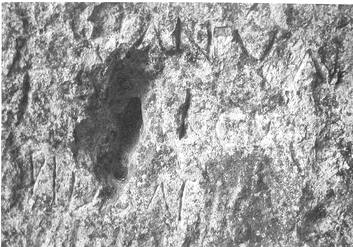
LÁMINA 2. Cueva Labrada (inscripción latina)

En ella, cerca de la entrada, aparece grabada una inscripción latina sobre la propia roca, a unos 80 cm del suelo, es decir, algo baja para leerla cómodamente erguido. Sin embargo, se encuentra a la altura de los ojos caso de que nos sentemos en los poyos anteriormente descritos. Se observan letras en al menos tres renglones (v. lám. 2), y quizás un cuarto, donde se perciben trazos que podrían formar parte de letras (irreconocibles en todo caso). No está enmarcada por ninguna moldura ni por incisiones que puedan acotar el campo epigráfico, y tampoco va acompañada de ningún tipo de ornamentación ni elementos decorativos.