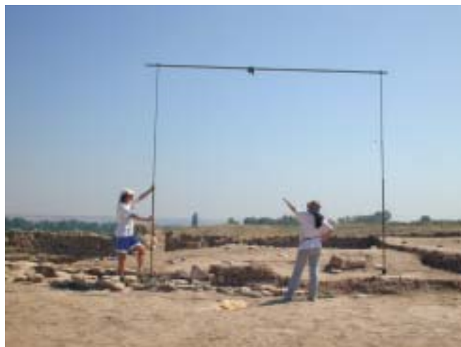
Fig. 5. Toma de pares estereoscópicos

También se han diseñado, construido y depurado prototipos de elementos auxiliares para la toma fotográfica de pares estereoscópicos constituyendo una auténtica aportación instrumental a este tipo de trabajos, ya que suponen una mejora en el rendimiento, disposición y posibilidad de control de la toma fotográfica (Fig. 5). (VALLE MELÓN, LOPETEGUI GALARRAGA, 2001).