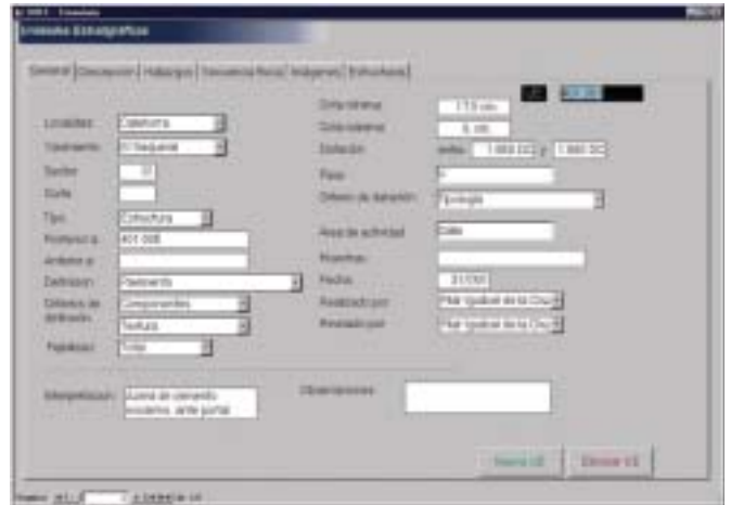
Fig. 2. Entrada de información en la base de datos

coordenadas de puntos que definen los objetos no fotografiados) se procede, mediante el consiguiente trabajo de gabinete, a la obtención de los documentos que formarán parte de la base de datos geométrica de cada uno de los yacimientos. En esta base de datos geométrica aparecerán representadas las unidades estratigráficas de forma que puedan ser utilizadas para el análisis arqueológico del yacimiento y constará de diversos tipos de representaciones: plantas, alzados, desarrollos, secciones... (Fig. 3).