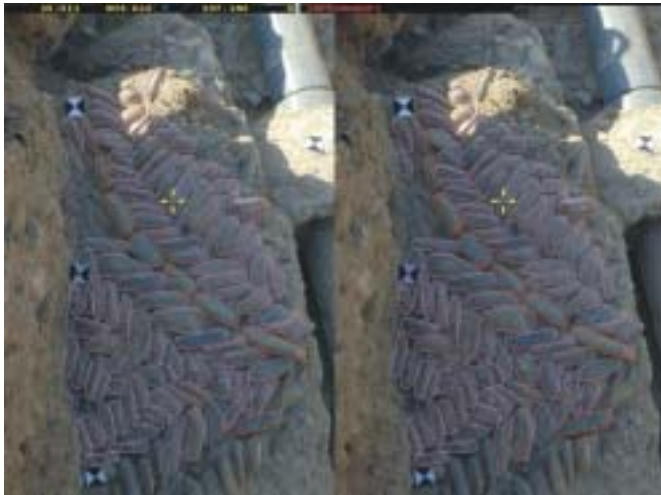
Fig. 1. Restitución fotogramétrica