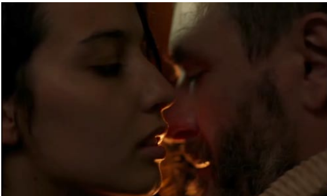
Iturria: Agüero, 2020.

Rostegi magistratua Ana ustezko sorginaren kontakizuna aditzen